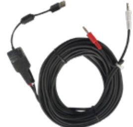
SD카드 연결선 10M