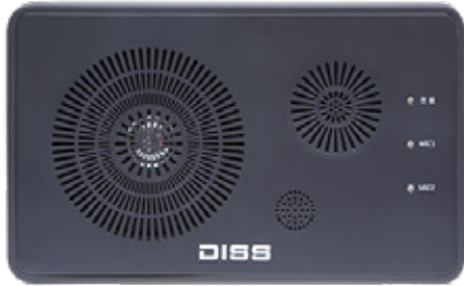
디지털 앰프 + 수신기 + 2개 스피커 일체형스피커