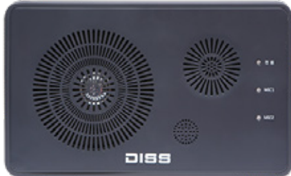
디지털 앰프 + 수신기 + 2Way 스피커 일체형스피커